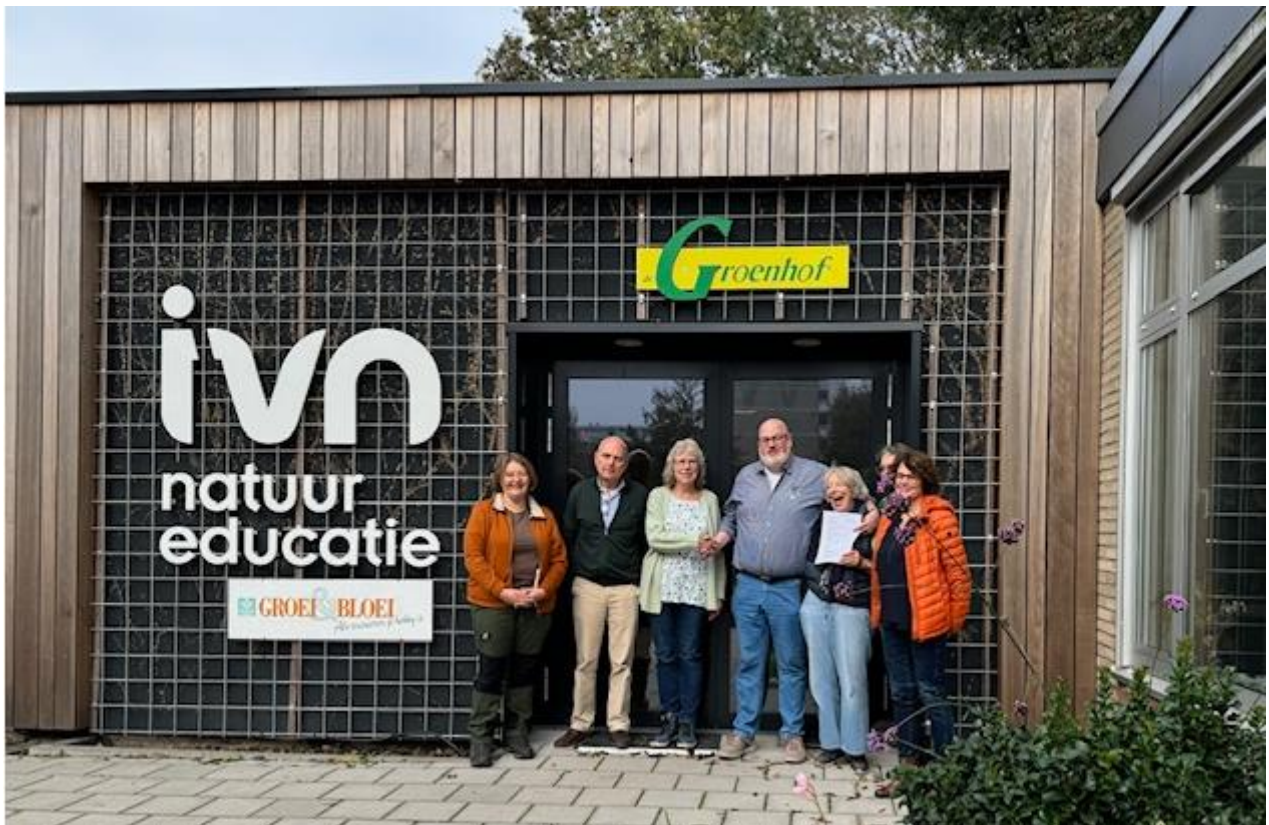
IVN en Groei & Bloei weer samen in de Groenhof